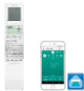
Komfort távirányító háttérvilágítású kijelzővel, heti időzítővel, csendes funkciókkal és 3D-Airflow funkcióval

* a WiFi modul opcionálisan kapható, a készülékbe építhető (18-as, 22-es és 24-es méret)