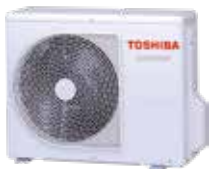
Kültéri egység (jelképes ábra)

→ Maximális A+++ hatékonyság „Suttogó” funkció & szuper ionizátor Két csendes üzemmód kültéri egységhez Plazmaszűrő