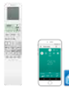
Komfort távirányító háttérlátógítású kijelzővel, heti időzítéssel, csendes funkciókkal és 3D-Airflow funkcióval

* a WiFi modul opcionálisan kapható, a készülékbe építhető